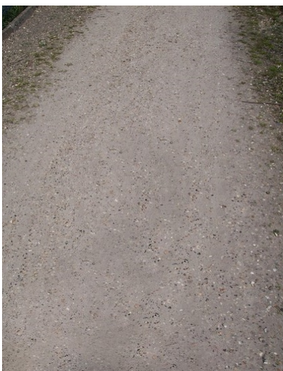
voor het harken

Let op ! De mensen die niet willen dat er gif op hun pad gespoten wordt zullen tevens ook gras en onkruid van hun pad dienen te verwijderen.