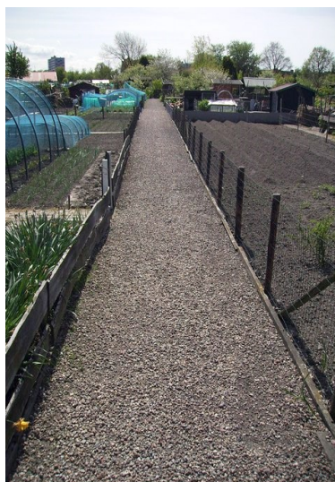
na het harken